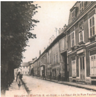
BELLOY-S.-MARTIN (S.-et-O.) — Le Haut de la Rue Faudon