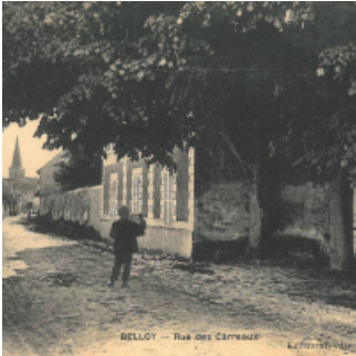
BELLOY — Rue des Carreaux