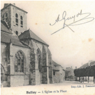
Belloy — L'Eglise et la Place