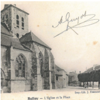
Belloy — L'Eglise et la Place