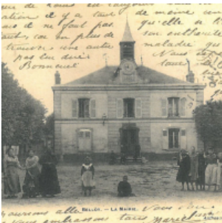
Belloy — La Mairie, l'ancien hôtel de ville