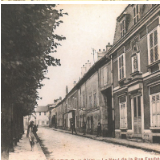
BELLOY-S.-MARTIN (S.-et-O.) — Le Haut de la Rue Faudon